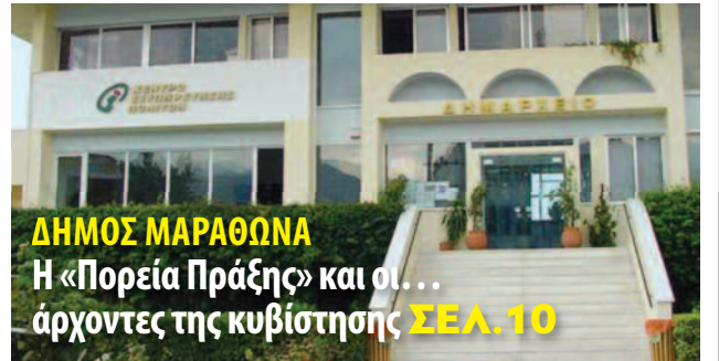
ΔΗΜΟΣ ΜΑΡΑΘΩΝΑ Η «Πορεία Πράξης» και οι... άρχοντες της κυβίστησης ΣΕΛ. 10