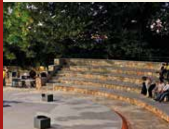
ΚΑΛΕΝΤΖΙ Πέτρινο Θέατρο Αγία Παρασκευή