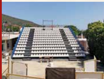
ΜΑΡΑΘΩΝΑΣ Θέατρο «Β. Τσάγκλος»