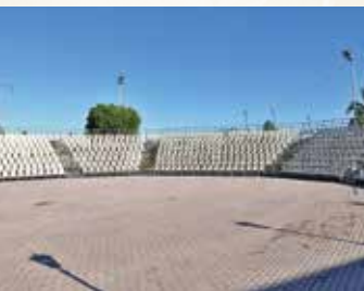
ΝΕΑ ΜΑΚΡΗ Θέατρο «Κώστας Βαγιανός» Αθλητικό & Πολιτιστικό Πάρκο