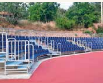
ΒΑΡΝΑΒΑΣ Θέατρο Παλιά Βρύση